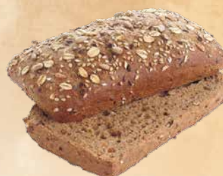
Waldkorn® Classic Carré