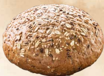
Waldkorn® Classic Reuzenbol