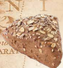
Waldkorn® Classic Pyramide junior